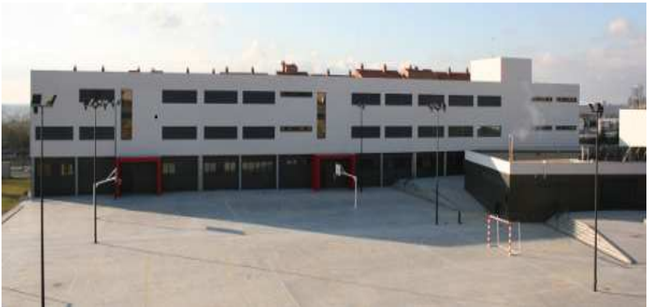
IES José Jiménez Lozano