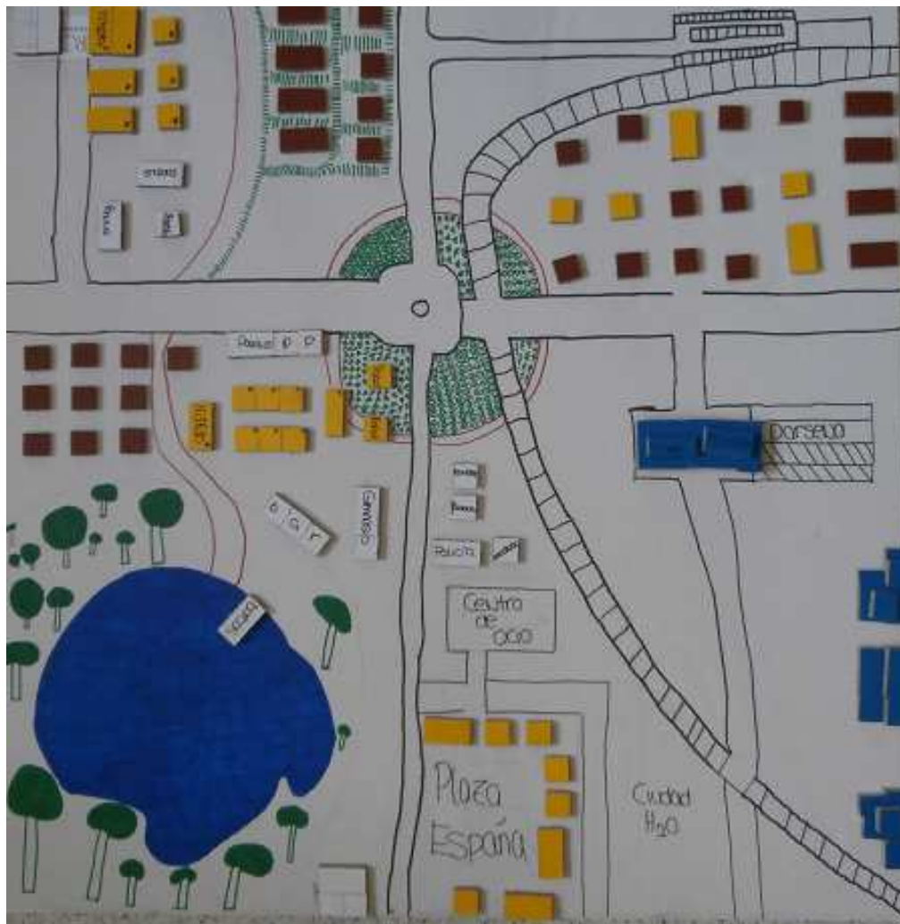
Uno de los diseños realizados y premiados en la edición del curso pasado por los alumnos del IES José Jiménez Lozano